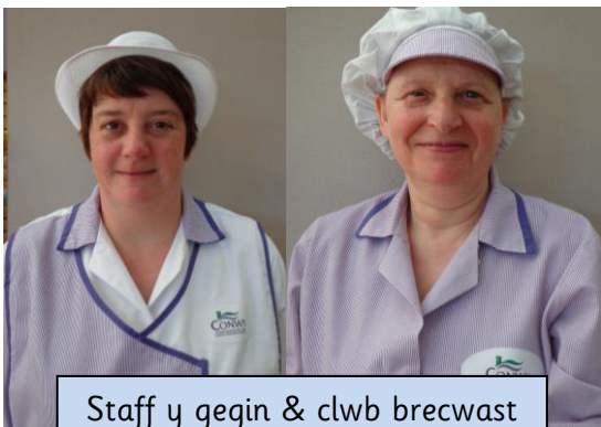
Staff y gegin & clwb brecwast