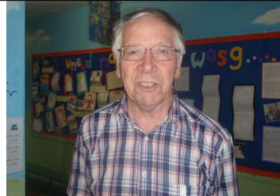
Warden y gymuned